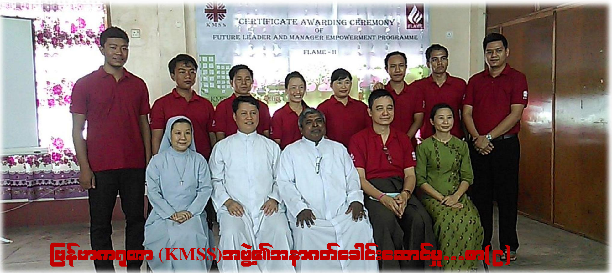
မြန်မာကဏ္ဍကာ (KMSS) အဖွဲ့၏ အနာဂတ်ခေါင်းဆောင်မှု...စာ(၉)