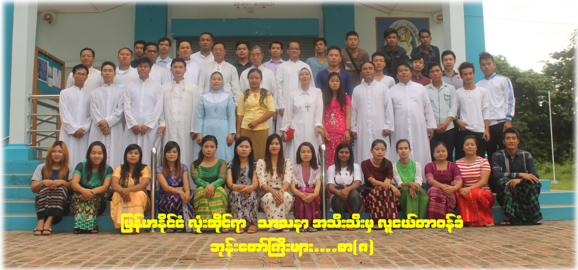
မြန်မာနိုင်ငံ လုံးဆိုင်ရာ သာသနာ အသီးသီးမှ လူငယ်တာဝန်ခံ ဘုန်းတော်ကြီးများ.....စာ(၈)