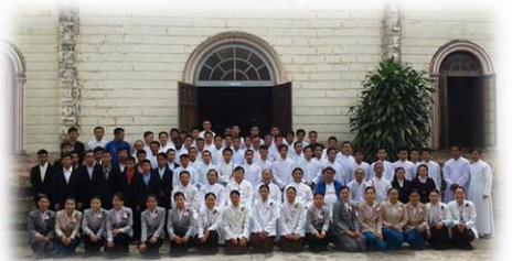
စာမျက်နှာ(၁၉)သို့